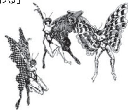
Randolph T. Hester (2006) "Design for Ecological Democracy", p112